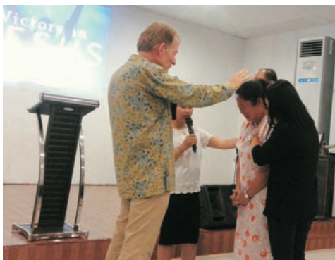
Foto links: Op deze derde zendingsreis op Centraal Borneo (een week lang, zie vorige NIEUWSBRIEVEN) was ik de leiding met hun grote herrie-geluidsboxen te snel af! Na de preek geven (pinkster)kerken vaak het sein om massaal naar voren te komen, met keiharde 'begeleiding' van de worshipgroep voor genezing of bevrijding... Maarrr.

Ik riep "Maaf, maaf! Sorry, sorry, stopstop; ik wil nu graag alleen een keer vóórdoen hoe ik zieken de handen opleg! Dus is er iemand die pijn heeft of ziek is?" DEZE VROUW (FOTO LINKS) KWAM NU NAAR VOREN, en keek alleen naar de grond. Toen ze eindelijk opkeek, schrok ik erg; haar hele gezicht was verwrongen van de pijn. Vreselijk! Toen ik de pijn wegstuurde was ze totaal genezen van pijn en depressie: wat stráálde ze en ik geef dan altijd applaus 'naar boven'. Dat heb ik geleerd omdat mensen – ook achterin – me dat nadoen en kunnen volgen wat God doet. Meer mensen kwamen naar voren en ik zei: "Jullie hebben nu gezien hoe ik het doe? Het is geen regel of methode, maar geloof alleen. Bestraf de pijn (spreek zoals Jezus zegt 'tégen de berg' over God – en niet tot God over die berg) en spreek genezing uit. Nu is het jullie beurt, want het gaat alleen maar om Jezus, en jullie zijn wedergeboren, ook 'anointed' en 'verzegeld' (en hebben misschien minder ongelof als ik!) en moeten handelen als ware discipelen!"