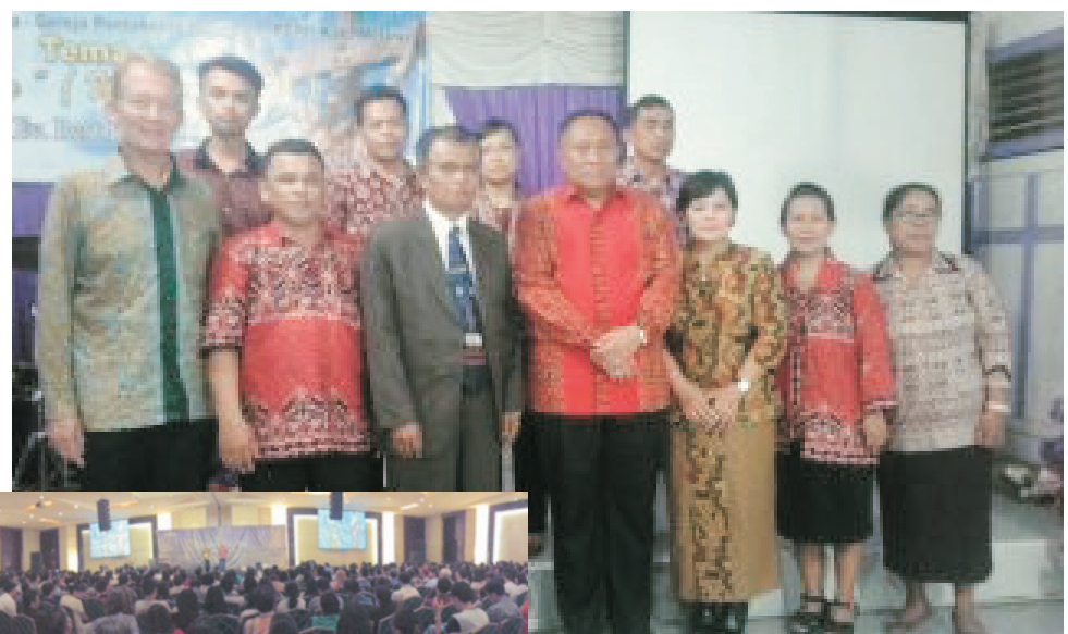
De burgemeester (rode batik) met vrouw zag ik zitten vooraan: dus preek aanpassen!

Ook nu eens 'Living Waters' bezocht in de jungle, prachtig en bovennatuurlijk hoe dit is ontstaan en groeit, tbv straks 1000 (arme, kansloze) kinderen uit de jungle-kampungs rondom; www.heyboer.org/nl